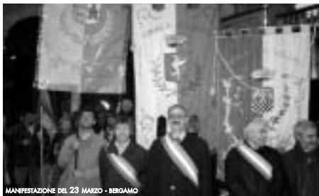
MANIFESTAZIONE DEL 23 MARZO - BERGAMO