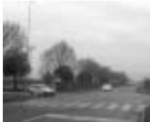
VIA OSIO SOPRA - OSIO SOTTO E OSIO SOPRA REALIZZERANNO IN COMUNE UNA PISTA CICLABILE DI COLLEGAMENTO

tratta di un bilancio che può essere letto come conclusione, consolidamento e proseguimento dei progetti iniziati. Un bilancio che rispecchia e traduce in azioni politiche concrete, i principi e le scelte presenti nel nostro programma elettorale del 1999.