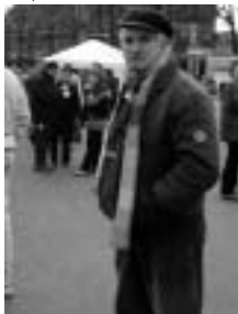
MANIFESTAZIONE DEL 16 FEBBRAIO - OSIO SOTTO

RICHIAMANDO l'art. 11 della Costituzione Italiana: "L'Italia ripudia la guerra come strumento di offesa alla libertà degli altri popoli e come mezzo di risoluzione delle controversie internazionali; consente in condizione di parità con gli altri stati, alle limitazioni di sovranità