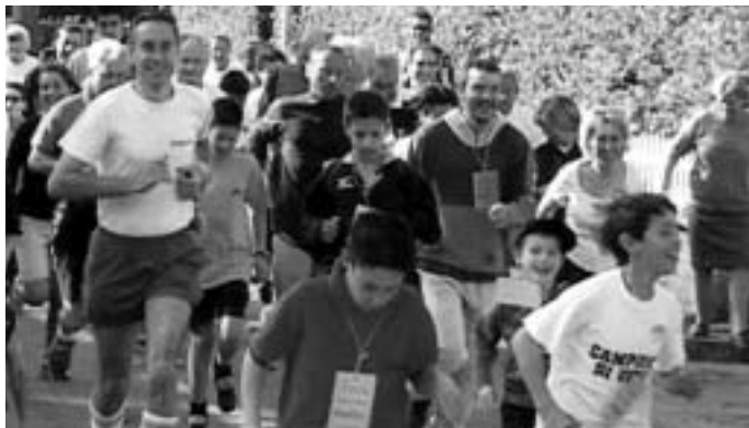
UN MOMENTO DELLA CAMMINATA - 2002