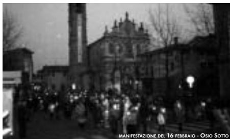
MANIFESTAZIONE DEL 16 FEBBRAIO - OSIO SOTTO