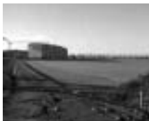
VIA LEVATE - AREA DI INSEDIAMENTO DEL CENTRO GIOVANILE

Da un lato segna una sorta di punto di arrivo. Dall'altro si mettono in campo ulteriori nuove rilevanti scelte.