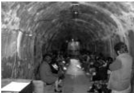
FOTO: DALMINE, RIFUGIO ANTIAEREO, DUE MOMENTI DELL'INCONTRO

Per i bambini e le bambine della scuola elementare il titolo del progetto, sempre nel mese di maggio, è "Alla ricerca dei libri rubati" dentro le stanze di Palazzo Visconti a Brignano Gera d'Adda.