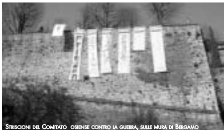
STRISCIONI DEL COMITATO OSIENSE CONTRO LA GUERRA, SULLE MURA DI BERGAMO

Il giorno 17 marzo si è riunito il Consiglio Comunale di Osio Sotto. All'ordine del giorno c'era la proposta del Comitato contro la guerra di sviluppare una riflessione in seno al Consiglio che producesse un voto chiaro contro questa guerra. Sulla base della nostra proposta il Consiglio ha elaborato una mozione unitaria che, nelle sue linee generali e per il fatto stesso di esserne stati lo stimolo, ci ha soddisfatto. I punti chiave, dalla nostra prospettiva, sono stati: una condanna netta del concetto di guerra preventiva e in particolare di quella unilaterale mossa dagli U.S.A. contro l'Iraq, sottolineando comunque la ferocia di Saddam Hussein e della sua dittatura; la contrarietà al coinvolgimento militare dell'Italia in un intervento di questa natura; la condanna dell'embargo che l'Iraq sta subendo da anni; l'affermazione che ogni controversia debba essere risolta con il diritto internazionale e la politica, non con le armi; il sostegno a quelle istituzioni che si muovono in tal senso, sottolineando però quanto sia auspicabile una maggiore coesione dell'Unione Europea sulle questioni internazionali e quanto sia urgente una riforma dell'ONU in una direzione che riequilibri i poteri al