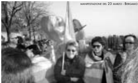
MANIFESTAZIONE DEL 23 MARZO - BERGAMO