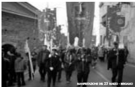
MANIFESTAZIONE DEL 23 MARZO - BERGAMO

3. istituire un apposito capitolo del bilancio denominato "Interventi per la promozione di una cultura della pace e della solidarietà tra i popoli".